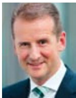
Dr. Herbert Diess, BMW AG